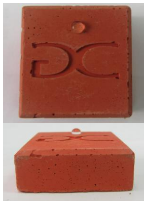
Pieza de colada elaborada con ADIFUGO

Aditivo para usar directamente en la elaboración de morteros y hormigones. Una vez seca la aplicación, esta queda impermeabilizada. Reduce la aparición de eflorescencias. Potencia el color. Es el complemento ideal para los morteros y hormigones coloreados. No altera la resistencia. La versión líquida permite una dispersión más fácil que la versión polvo.